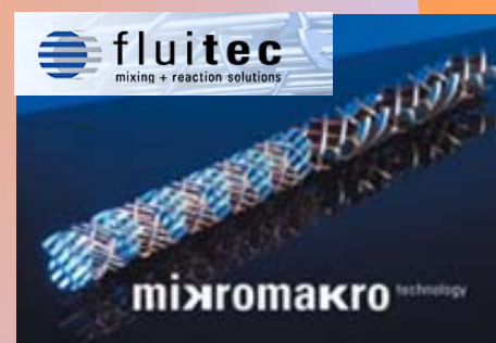
Mélangeur mikromakro Fluitec

Le mélangeur statique constitue la clé du mélange gaz/polyol, puisque c'est à ce niveau-là que la nucléation proprement dite opère. Celui-ci combine la forme particulière spécialement étudiée d'un élément mélangeur inséré dans un tube à l'énergie imprimée au produit, conduisant à un flux turbulent dans la veine fluide. De ce fait on obtient un fort potentiel de mélange tout en engendrant une perte de charge minimale.